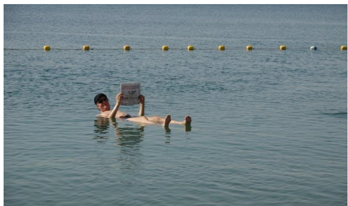
Totes Meer, stimulierende «Schwereelosigkeit».