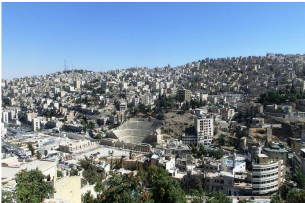
Amman, die antik-moderne Hauptstadt.

Höhepunkt ist die Felsenstadt Petra , die das Beduinenvolk der Nabatäer ab dem 6. Jahrhundert vor Christus in den rötlichen Stein geschlagen hatte. Auch Griechen, Römer, Kreuzritter, Christen und Muslime hinterliessen beeindruckende Spuren auf dem Territorium des heutigen Jordaniens. Ebenso besitzt das Land spektakuläre Landschaften wie etwa die faszinierende Wüstenregion Wadi Rum , und nicht weit davon entfernt das Rote Meer mit paradiesischen Korallenriffen und reichen Fischgründen. Ausserdem lässt sich in Jordanien die vielfältige levantinische Küche geniessen, und erstaunlich guter Wein wird produziert.