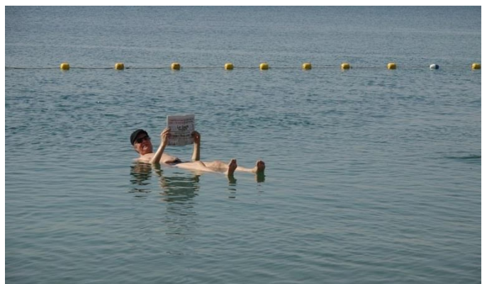
Totes Meer, stimulierende «Schwereelosigkeit».