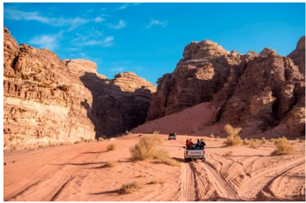
Wadi Rum, die Wüste fasziniert.